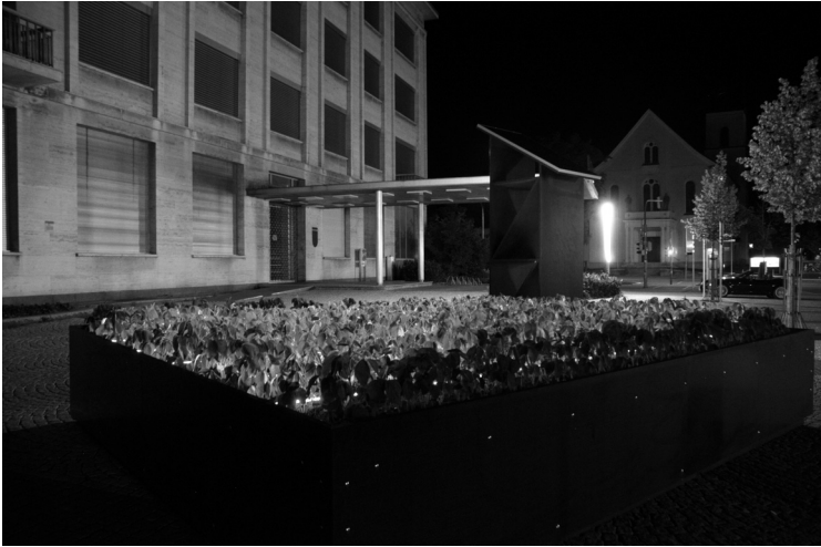
Abb. 6 National Security Garden bei Nacht