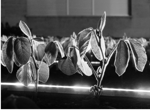
Abb. 3 Sojapflanzen mit wachstumsfördernder LED- Beleuchtung

Licht ist auf das Pflanzenwachstum optimiert, ähnliche Beleuchtungen werden schon jetzt in Gewächshäusern eingesetzt und auch in landwirtschaftlichen Forschungszentren, wie z.B. an unserer Heimatinstitution, der Purdue University in West Lafayette (Indiana, USA) weiterentwickelt. Da dieses System eine Bestrahlung mit wachstumsförderndem Licht über 24 Stunden am Tag ermöglicht, stellt sich in der National Security Garden -Installation bio-technisch die Frage, welchen Anteil die künstliche Beleuchtung zum Wachstum der Pflanzen leisten kann, denn für ein ausgewogenes Pflanzenwachstum sollte die lichtgesteuerte Photosynthese (Assimilation) durch Zellatmung (Dissimilation) nachts ausgeglichen werden. Eine zeitlich genau abgestimmte Beleuchtung mit Kunstlicht kann also das Wachstum stimulieren, aber eine zu lange Bestrahlung wirkt sich möglicherweise sogar schädlich auf die Entwicklung der Pflanzen aus. Für uns entsteht durch diese Situation eine Parallele zu anderen technologischen Eingriffen in die Natur – von landwirtschaftlichen Maschinen über petrochemische Pflanzenmittel bis hin zur Gentechnik: Es kommt auf eine genau justierte Balance an, bei der sich die Grenzen zwischen Nutzen und Schaden für Umwelt und Menschen ständig verschieben können.