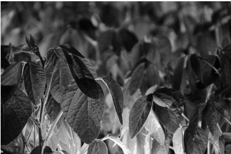
Abb. 5 Sojapflanzen im National Security Garden bei Nacht