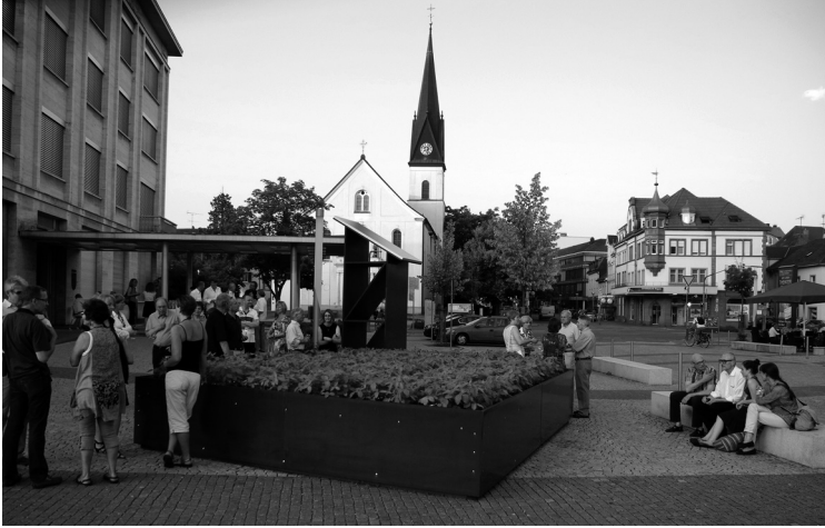
Abb. 8 Gespräche am National Security Garden in Singen

Nutzpflanze aus der Landwirtschaft in den Gartenbau ist es unser Ziel, ebenfalls zum Nachdenken anzuregen – über zeitgenössische »Maschinen im Garten.« Nachdem das Industriezeitalter den Weg frei gemacht hat für eine post-industrielle, biotechnologische Ära stellt sich damit die Frage: Welche Auffassungen von Natur und Politik liegen diesen neuen »Maschinen im Garten« zugrunde?