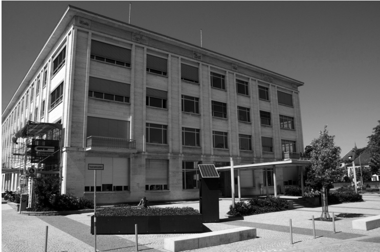
Abb. 1 National Security Garden vor dem Rathaus in Singen / Htwl.

Ästhetik, sie erscheint von vorne betrachtet solide und schwer, bekommt aber eine Leichtigkeit und Transparenz in ihrer Seitenansicht und erlaubt den Durchblick auf die Pflanzen.