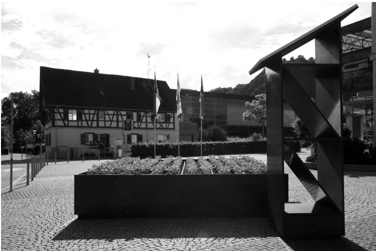
Abb. 7 National Security Garden bei Tag