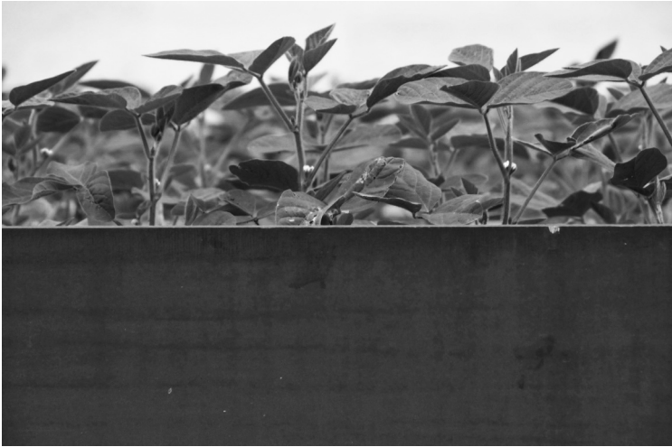
Abb. 4 Sojapflanzen im National Security Garden bei Tag